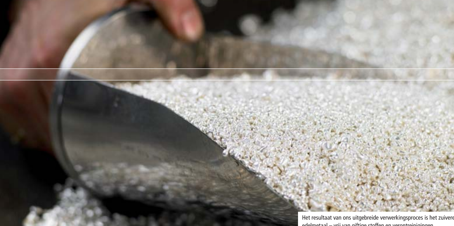
Het resultaat van ons uitgebreide verwerkingsproces is het zuivere edelmetaal – vrij van giftige stoffen en verontreinigingen.